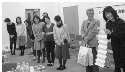
タウン記者交流会で2015MVPをとり表彰される、さいたま市担当の皆さん

埼玉県朝霞市生まれ。埼玉大学教育学部卒業。地域報道部記者、県北支社編集キャップ、編集局ニュースセンター次長・報道デスク、クロスメディア局企画編集部長などを経て、現在、編集局長代理。アニメなどサブカルチャーに特化した特集紙面「サイタマニア」の編集も手掛けたほか、ケーブルテレビ「COM」で隔ニュース解説も担当。PTAをはじめ、自治体やNPO、生協などの広報研修会講師など数多く実施。著書：『ホームレス暴行死事件～少年たちはなぜ殺してしまったのか』(新風舎文庫)＝現在はネットのみで流通