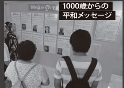
1000歳からの 平和メッセージ