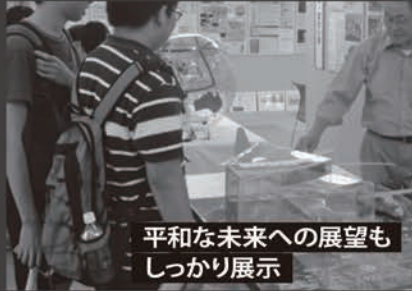
平和な未来への展望も しっかり展示