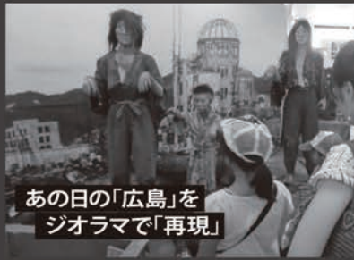
あの日の「広島」を ジオラマで「再現」