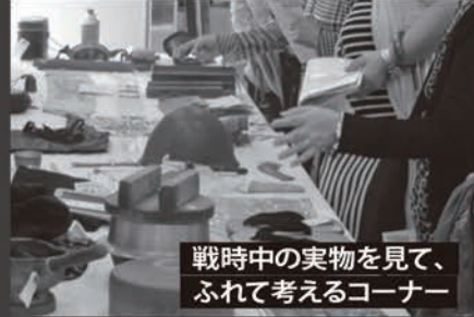
戦時中の実物を見て、 ふれて考えるコーナー