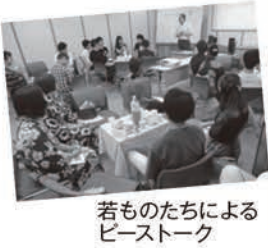
若ものたちによる ヒーストーク